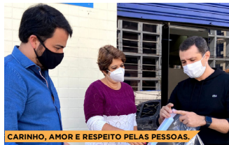
CARINHO, AMOR E RESPEITO PELAS PESSOAS.

Em menos de quatro anos, mais de R$ 10 milhões investidos!