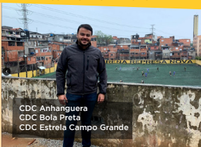
CDC Anhanguera CDC Bola Preta CDC Estrela Campo Grande