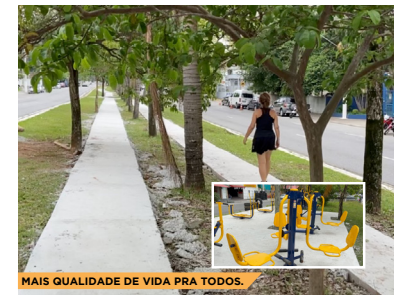
MAIS QUALIDADE DE VIDA PRA TODOS.

Com a indicação do Vereador, foram implantados 28 novos aparelhos de ginástica ao ar livre no canteiro central da Avenida Engenheiro Alberto de Zagottis, além de uma nova pista de caminhada. Moradores que não tinham onde praticar atividades físicas e passear com animais, hoje usufruem de um grande espaço público com equipamentos de qualidade e de fácil acesso.