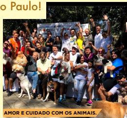
AMOR E CUIDADO COM OS ANIMAIS.