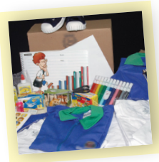
UNIFORME E MATERIAL ESCOLAR SÃO GRATUITOS GRAÇAS AO GOLART!

Uma grande transformação na vida de milhões de famílias, roupas novas para quem não tinha possibilidade de comprar.