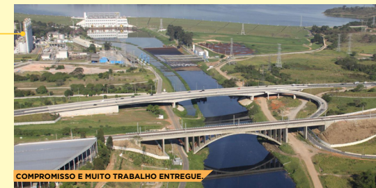
COMPROMISSO E MUITO TRABALHO ENTREGUE.

Atenção aos problemas de mobilidade e trânsito é marca registrada dos mandatos do Goulart. Muitos não acreditavam na construção da Ponte Vitorino Goulart, hoje, ela atende mais de um milhão de pessoas e é a obra viária mais importante da região.