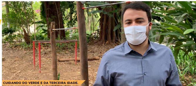
CUIDANDO DO VERDE E DA TERCEIRA IDADE.