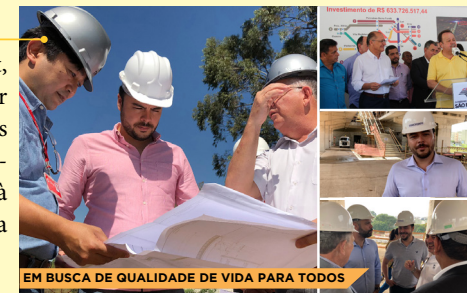
EM BUSCA DE QUALIDADE DE VIDA PARA TODOS