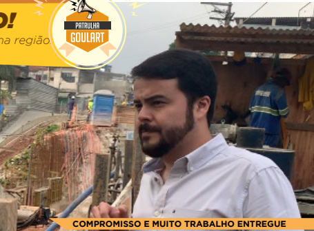
COMPROMISSO E MUITO TRABALHO ENTREGUE