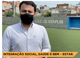
INTEGRAÇÃO SOCIAL, SAÚDE E BEM-ESTAR.