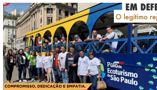
COMPROMISSO, DEDICAÇÃO E EMPATIA.

O legítimo representante do Polo de Ecoturismo na Câmara