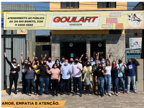
AMOR, EMPATIA E ATENÇÃO.

Há mais de 20 anos, o Escritório Goulart mantém as portas abertas para a população. A equipe especializada está atenta para ouvir, atender e cobrar as necessidades de todos os munícipes. Avenida do Rio Bonito, 2126. Segunda a Sexta, das 9h às 18h.