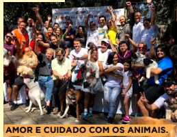
AMOR E CUIDADO COM OS ANIMAIS.