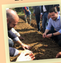
Valorização da agricultura na Zona Sul