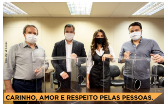
CARINHO, AMOR E RESPEITO PELAS PESSOAS.

Em menos de quatro anos, mais de R$ 10 milhões investidos!